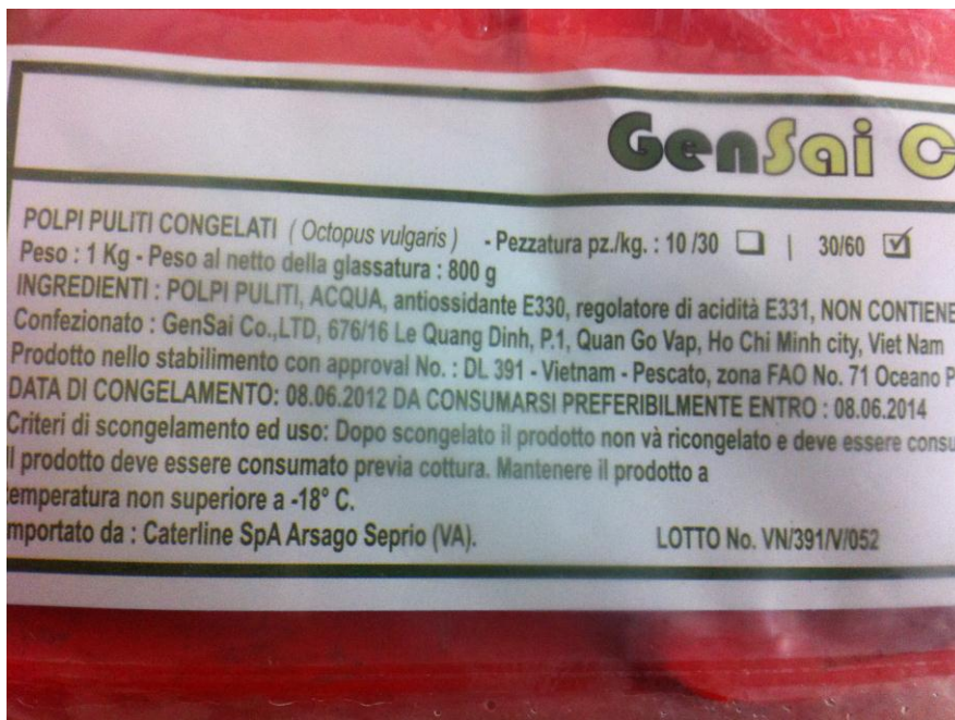
... polpi vietnamiti (zona FAO 71) ...